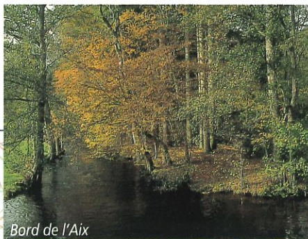
Bord de l'Aix